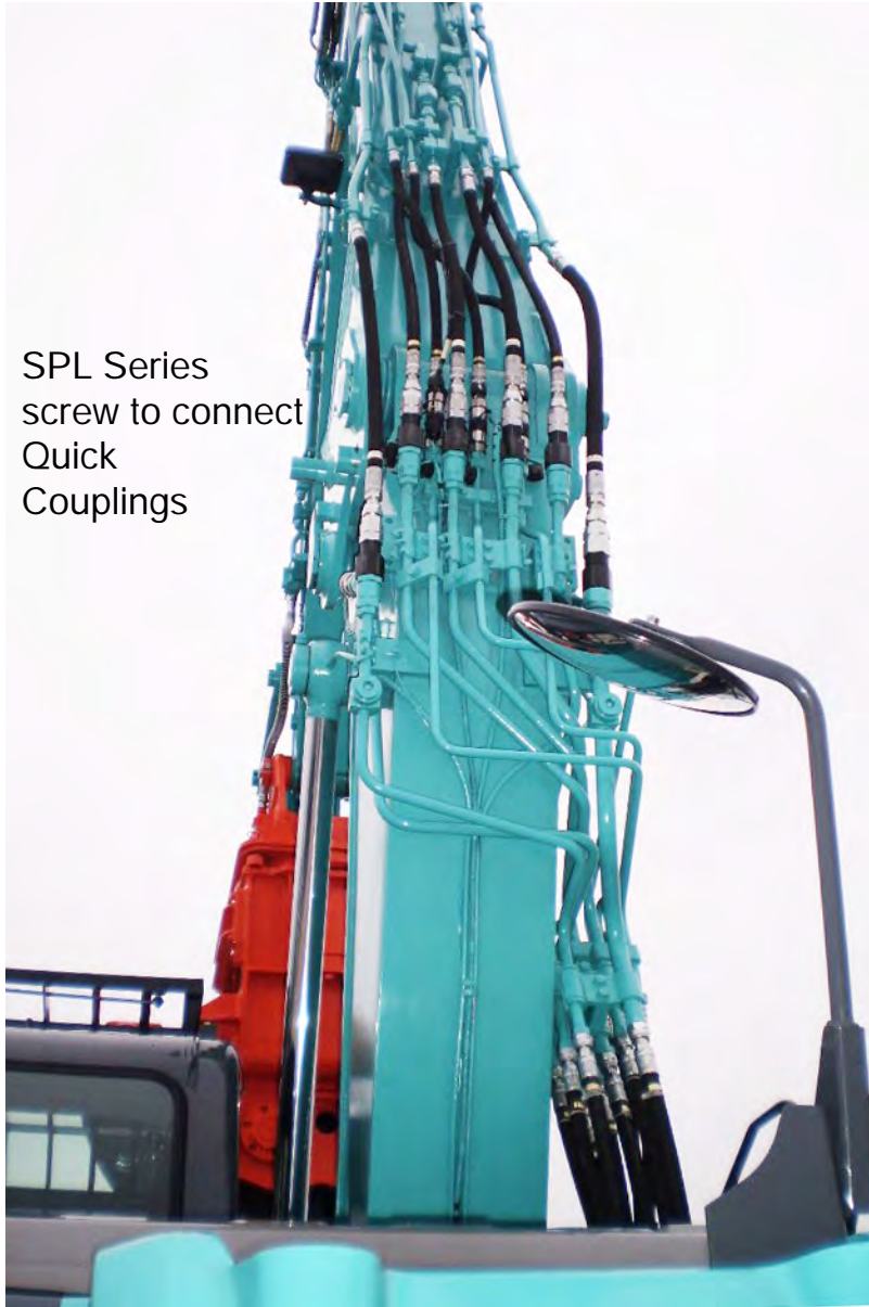
SPL Series screw to connect Quick Couplings

Heavy Duty Hammers and Demolition Quick couplings